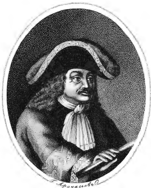
Петръ Ивановичъ Гордонъ, Генералъ Аншесфрэд

Изъ Собранія Поршрешовъ издаваемыхъ Платономъ Бекешовымъ