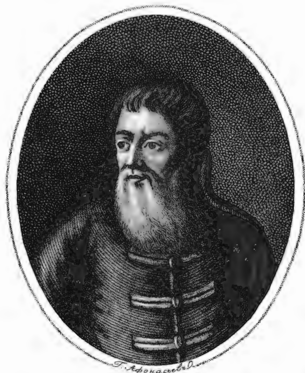
Никита Моисеевичъ Зотовъ, Наставникъ Царевича Петра Алексеевича