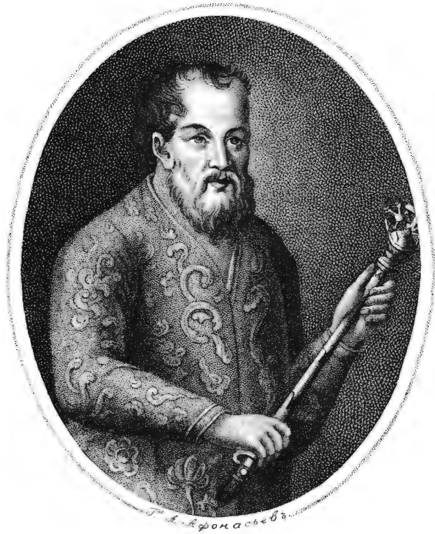
Князь Дмитрій Михайловичъ Пожарскій, Бояринъ.