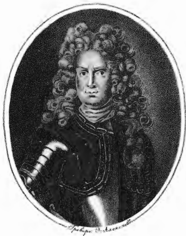
Баронъ Георгъ Венедиктъ Ѡ Огильвій, Генералъ Фельдмаршалъ Лейтенантъ.

Изъ Собранія Портретовъ издаваемыхъ Платономъ Бекетовымъ.