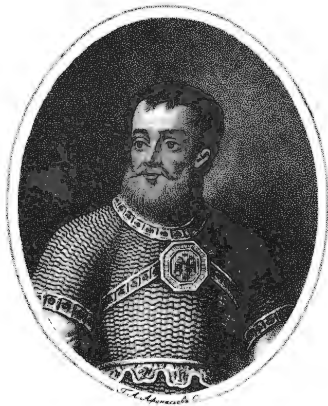
Князь Яковъ Куденетовичъ Черкасскій, Бояринъ и Большаго Полку Всевода.

Изъ Собранія Портретовъ издаваемыхъ Цямономъ Векетовымъ .