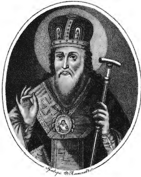
Стефанъ, Первый Епископъ Пермскій.

Изъ Собранія Портретовъ издаваемыхъ Платономъ Бекетовымъ